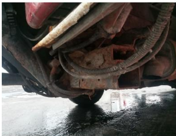
obr. 3 - nosný rám