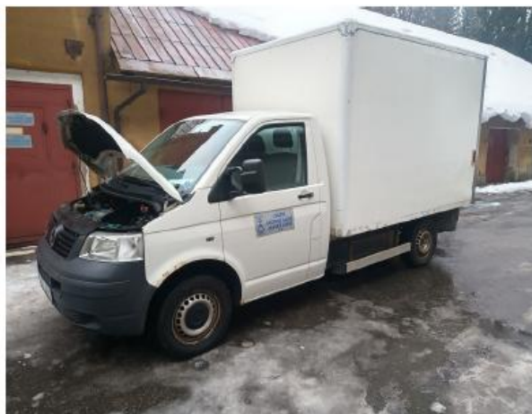
obr.2 - levý pohled