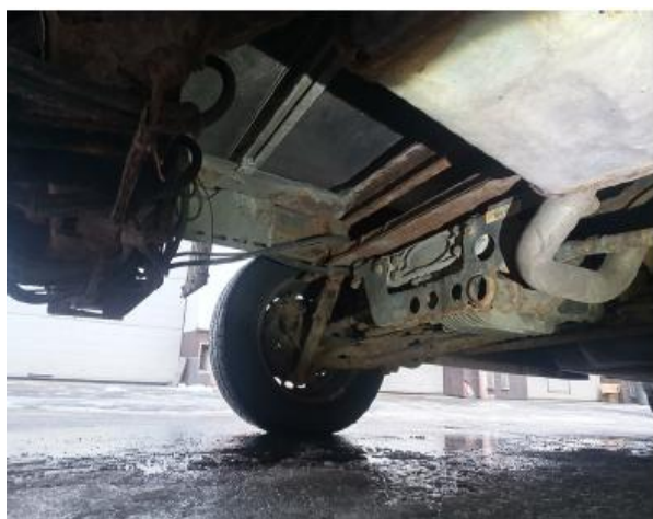
obr. 5 - nosný rám