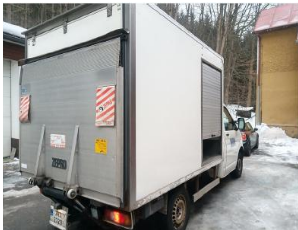
obr. 1 - pravý zadní pohled