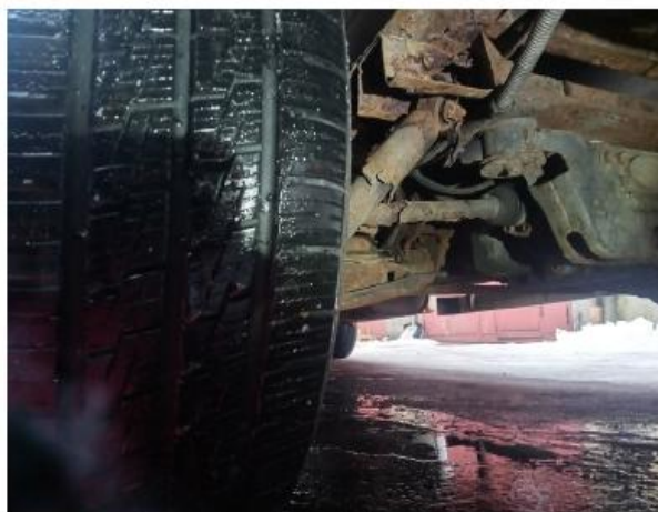
obr.4 - uchycení tlumiče+hnací poloosa