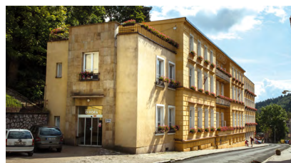
Evropa Dependance 50 m od centra, výtah, WiFi.