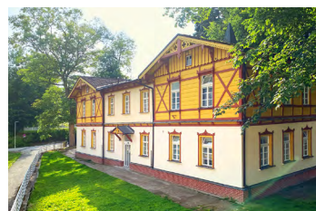
Čechie Dependance v centru, bez výtahu, WiFi.