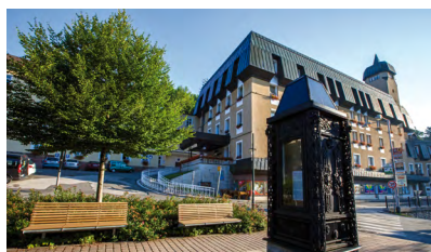
Janský Dvůr Hlavní budova, výtah, WiFi.