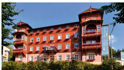
Hotel Terra Hotel v centru, hlavní budova, výtah, WiFi.